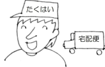
宅配便 のお兄さん