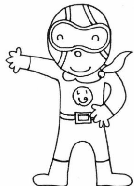
いのるンジャー ディボーションのチカラで世界に 平和をもたらすために戦っている