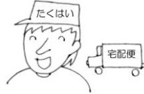
宅配便 のお兄さん